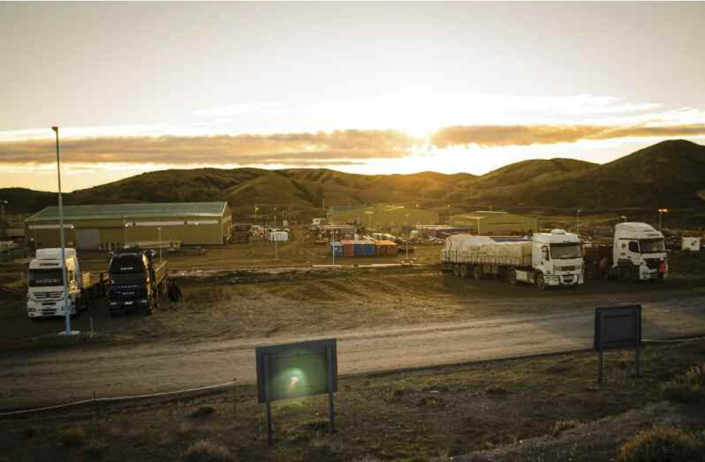
La mina Cerro Negro, un activo de relevancia en el portfolio de Newmont

En materia de inversión, ¿qué esfuerzos ha realizado la compañía en el país y cuál es la visión a futuro respecto a la participación de Newmont en Argentina? ¿Qué rol juega Cerro Negro en el portfolio global de Newmont?