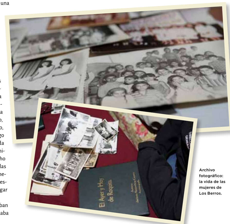
Archivo fotográfico: la vida de las mujeres de Los Berros.