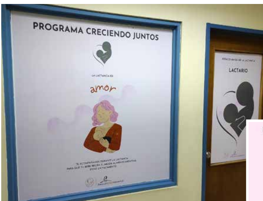
El lactario en Cerro Vanguardia, parte del proyecto Creciendo Juntos

El Comité de Diversidad y Género de Cerro Vanguardia, creado en 2021 y formado por mujeres y hombres de distintas áreas y posiciones de la empresa, detectó que uno de los puntos críticos está relacionado a la maternidad, y por ello se puso en marcha un programa para brindar respuesta a las mujeres que atraviesan la etapa de lactancia.