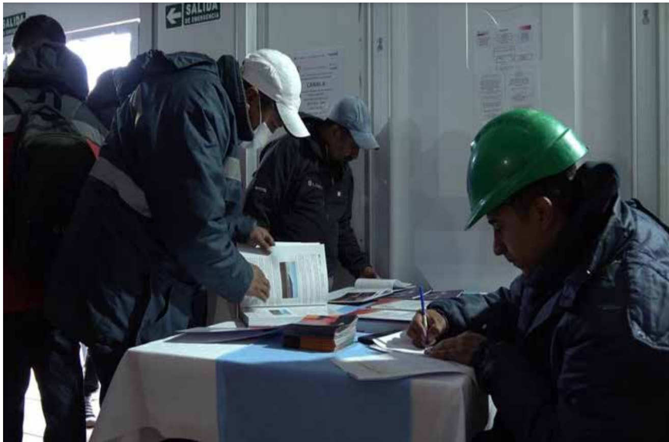
Comunidades locales apoyaron el desarrollo del proyecto de litio Fénix.

El pasado 12 de agosto se realizó la última audiencia en el Salar del Hombre Muerto, en Catamarca, con más de 150 miembros de las comunidades antofagasteñas que integraron el proceso de consulta pública. El proceso consistió