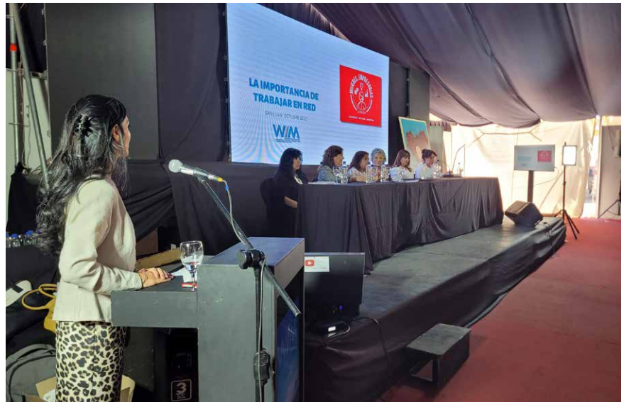
Toda la industria se hizo presente en la Expo San Juan Minera 2022.