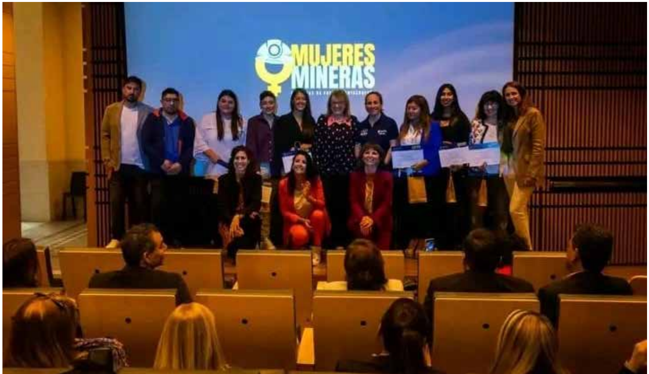
Una provincia donde la mujer es protagonista: Santa Cruz y un importante apoyo a la mujer minera.