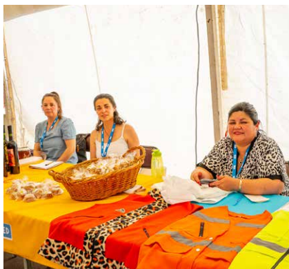
Emprendedoras comparten sus productos en la exposición de Panorama Minero.