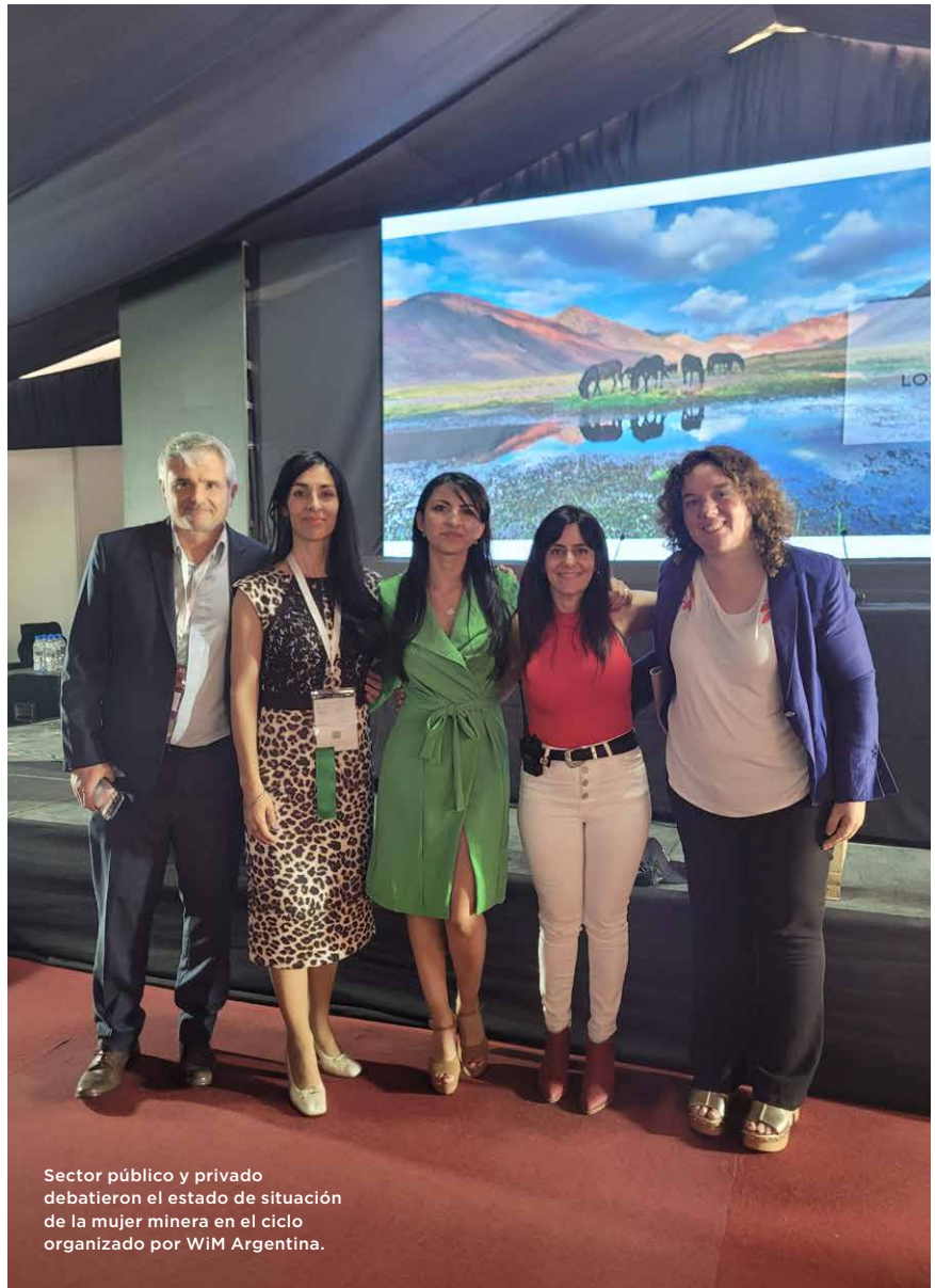
Sector público y privado debatieron el estado de situación de la mujer minera en el ciclo organizado por WiM Argentina.

Del encuentro participaron instituciones nacionales y locales de San Juan, líderes empresarios, emprendedoras y referentes de la comunidad que compartieron buenas prácticas para la inclusión de la mujer en la industria, a la vez de presentar distintos casos de éxito en el trabajo en red y brindar su testimonio sobre las diferentes iniciativas gestadas a nivel comunitario. Seguido de un análisis ligado a la empleabilidad minera en la región y la palabra de integrantes de empresas privadas y proveedores de bienes y servicios, el encuentro estuvo acompañado por estudiantes y jóvenes profesionales, quienes pudieron saldar distintos interrogantes ligados a las posibilidades de inserción laboral que brinda la actividad minera en estas zonas del país.