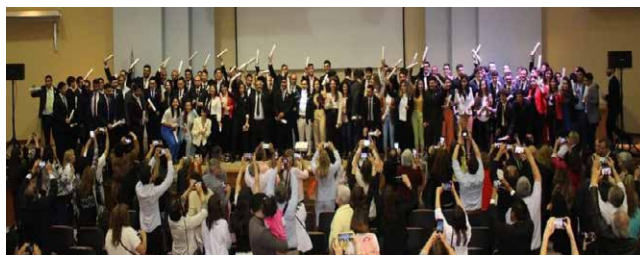
Nuevos profesionales: jóvenes en el acto de colación de UNSJ.

Gran parte de esta actividad se desarrolla en lugares inhóspitos y con cronogramas de trabajo que llevan a los profesionales a estar alejados de su entorno más cercano, por lo que es un factor importante a tener en cuenta a la hora de inclinarse a vivir de este tipo de profesión, sin distinción alguna en cuanto a género. En el caso de las mujeres, sin embargo, creo que esto no es un tema menor e implica todo un proceso de adaptación que demanda un cierto estrés mental y físico. Desde hace ya un tiempo se ha venido incrementando la