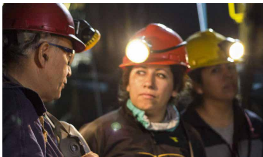
Mujeres de la minería santacruceña.