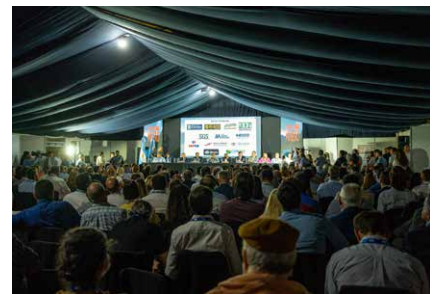
Sala llena: Toda la industria se hizo presente en la Expo San Juan Minera 2022.

En números, la denominada "expo minera de la gente" dejó un saldo de 14.000 asistentes, 186 expositores, más de 100 patrocinadores oficiales y la participación de las principales compañías mineras con operaciones en el