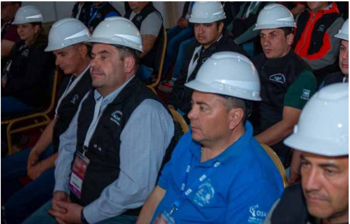
Cascos en alto: La minería celebra un nuevo 28 de octubre en reconocimiento a sus trabajadores.