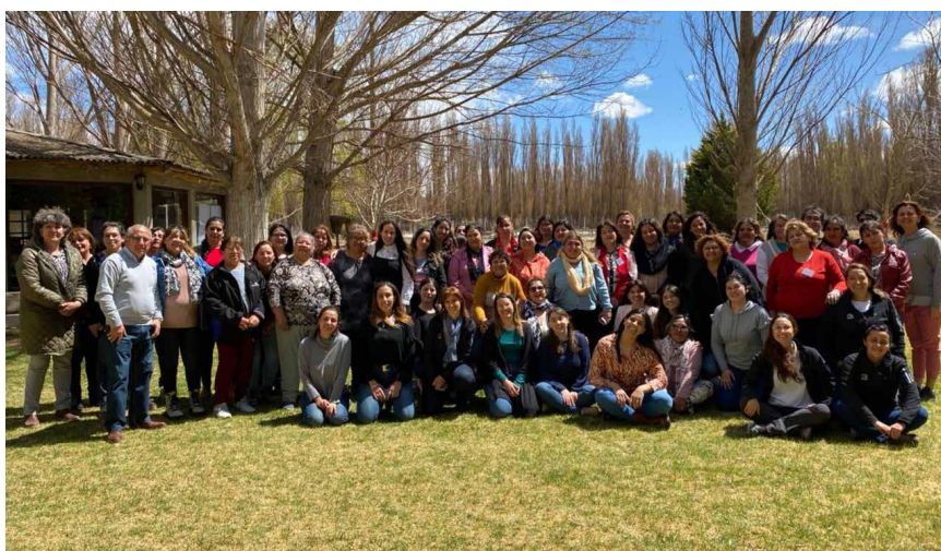
Clima de unidad: “Emprender en red es más fácil”.

En su primer año de vida, la red está conformada por 48 emprendedoras de diferentes localidades del departamento de Iglesia que ofrecen tanto productos como servicios gastronómicos, estéticos y turísticos. “En cuanto a los productos, un grupo de ellas son artesanas especializadas en tejidos al telar, a dos agujas y crochet; mientras que otras se focalizan en la producción de indumentaria y accesorios, por ejemplo, para niñas y niños.