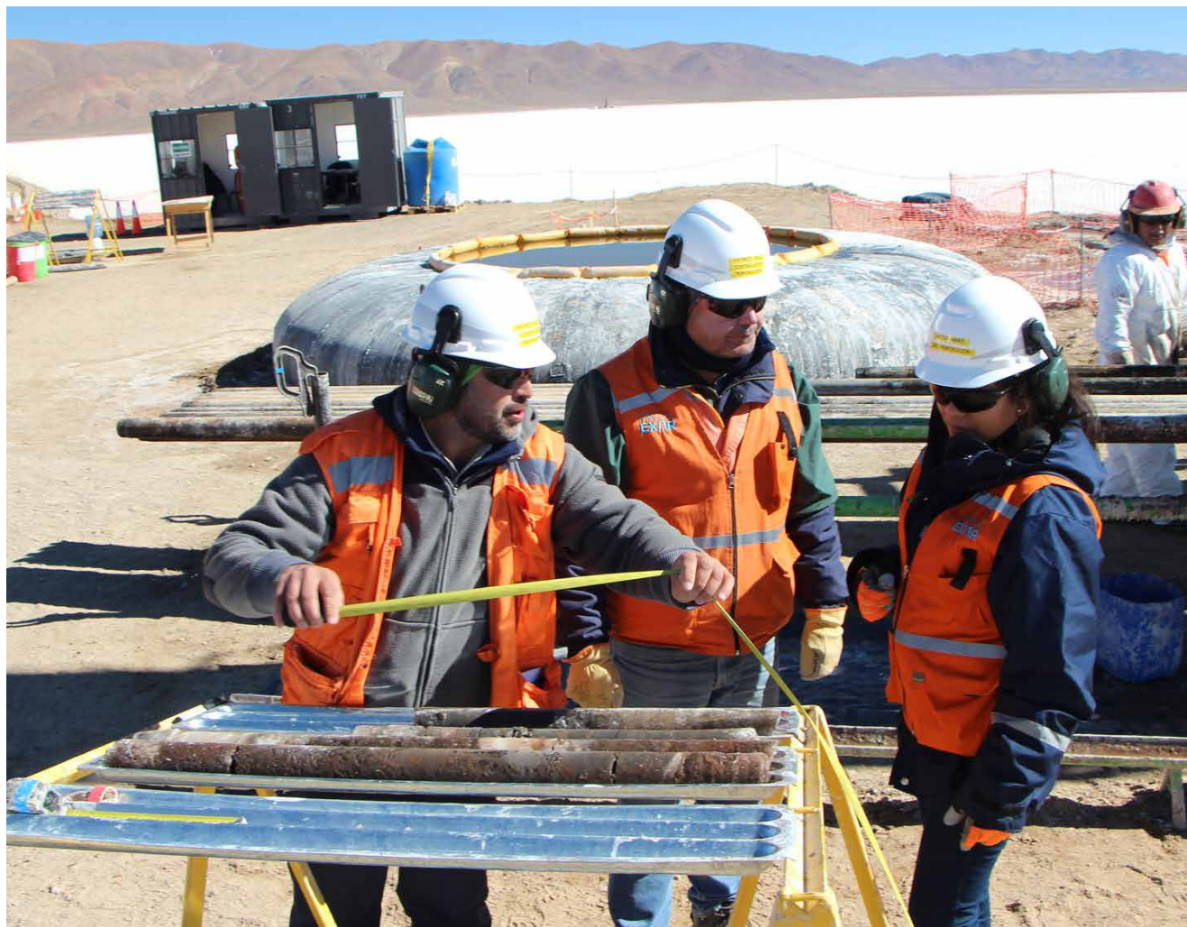
Trabajadores mineros. Se celebran los 69 años de la fundación de AOMA.