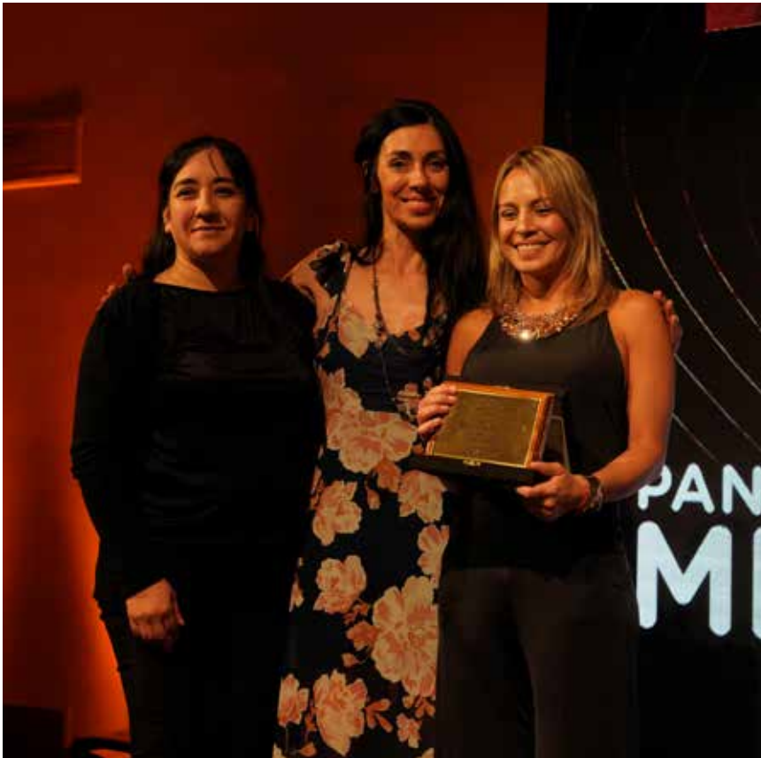
“La diversidad es uno de nuestros pilares”, precisó Uriburu.