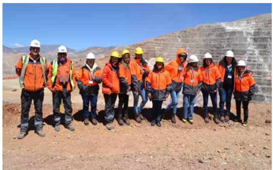
Los equipos mixtos ganan terreno en la industria minera.

Por un feliz 2023 para toda la industria, especialmente para las mujeres mineras que siguen rompiendo paradigmas y trabajando por un mundo más justo. ●