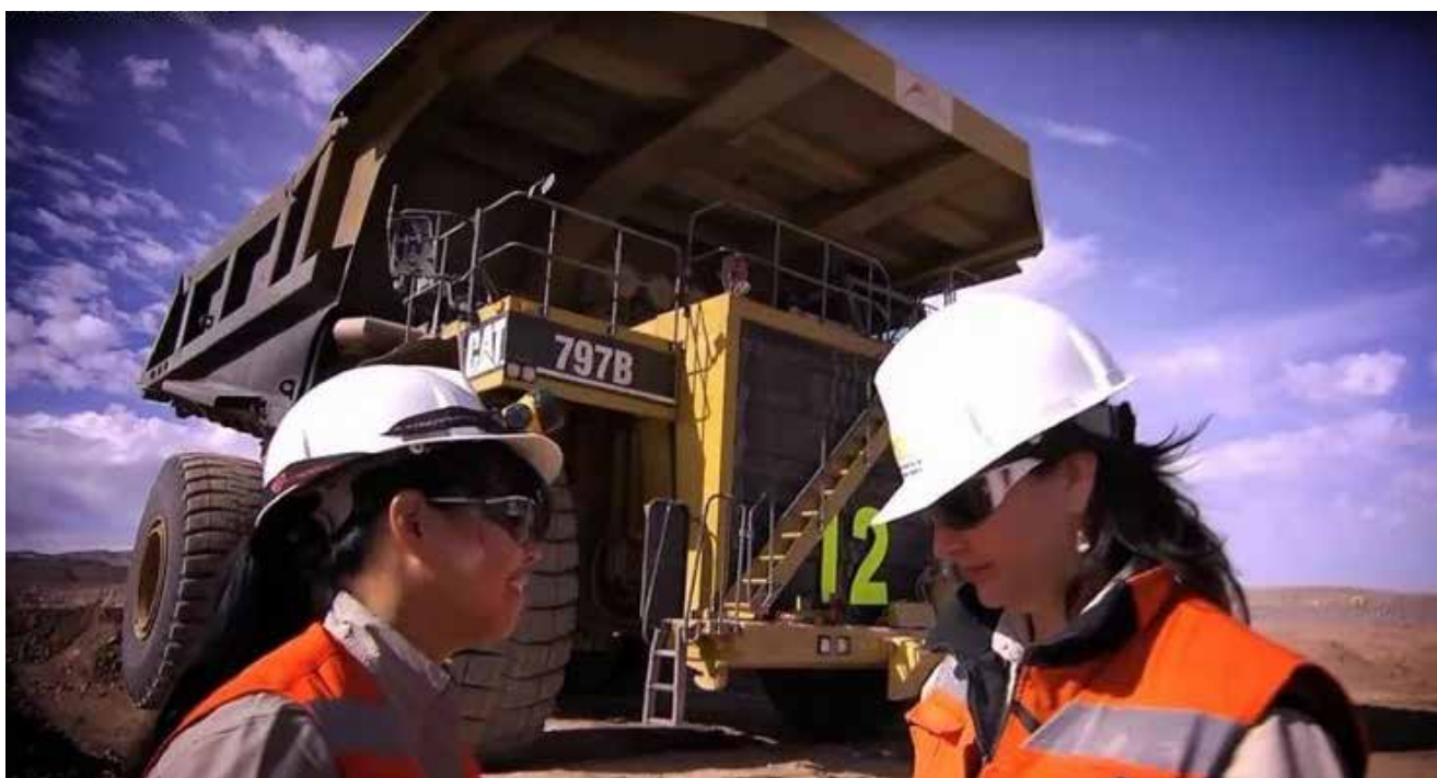
Más minería, más oportunidades para las mujeres.